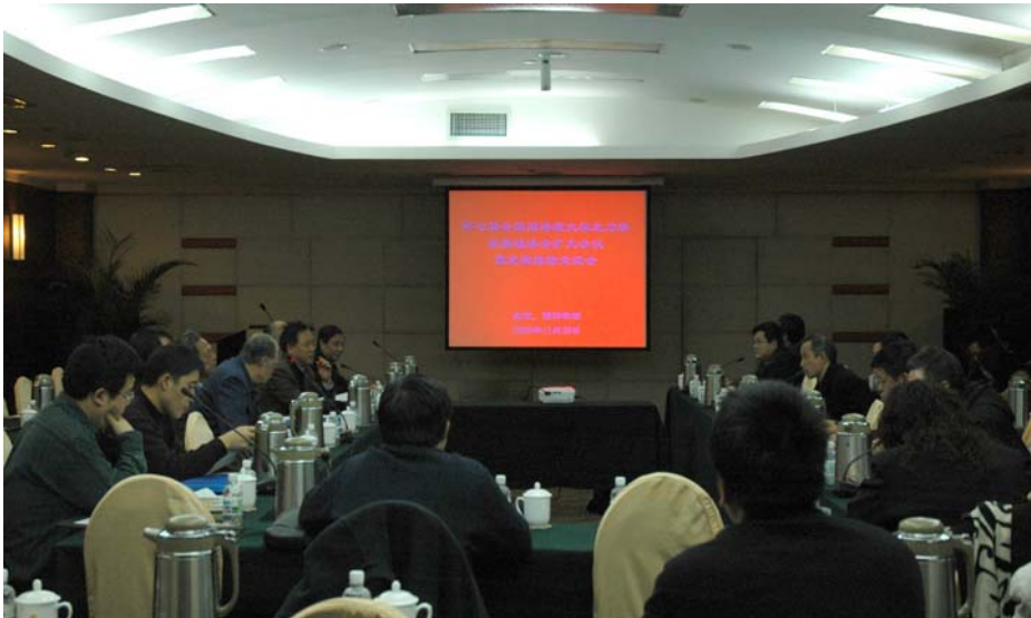
第七届全国周培源大学生力学竞赛组委会扩大会议暨竞赛经验交流会