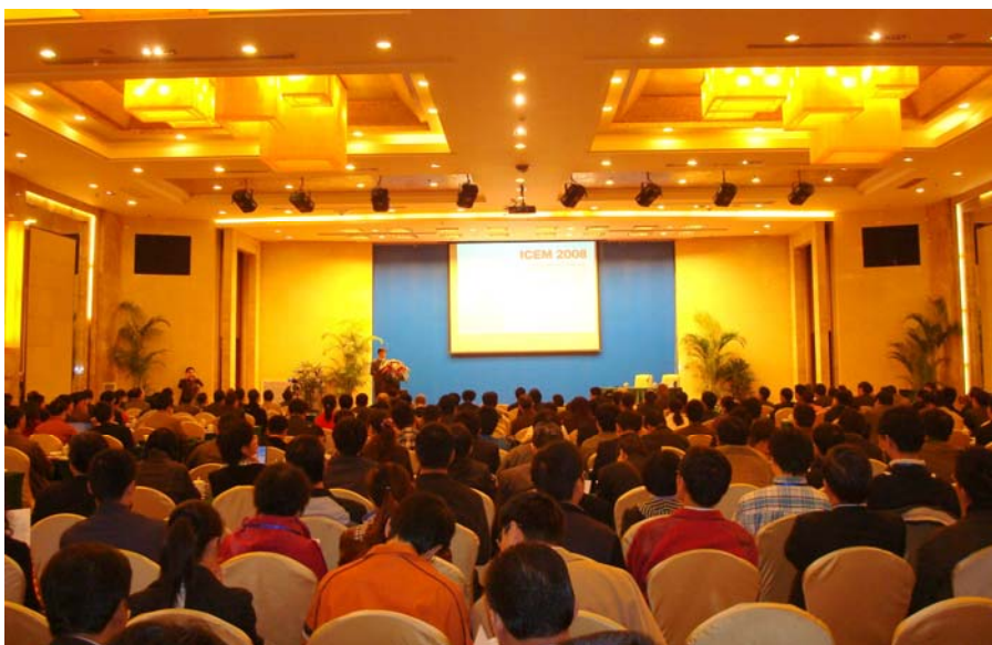
2008 国际实验力学会议 (ICEM 2008)