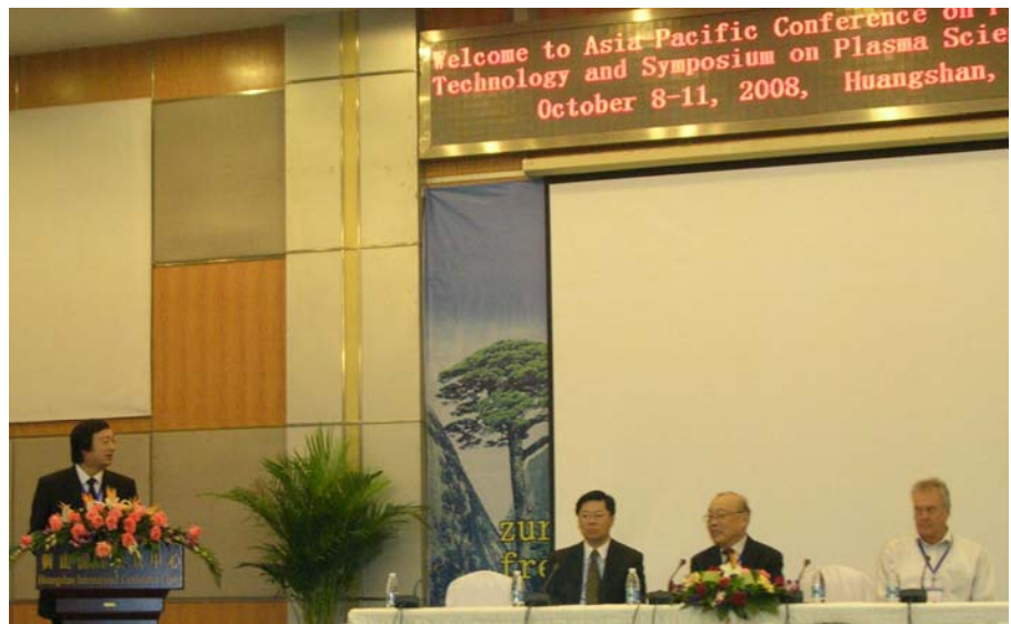
第9届亚太等离子体科学与技术会议