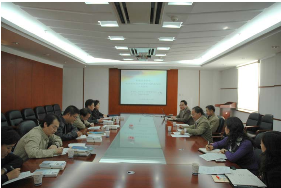
中共中央办公厅调研组和中国科协在中国力学学会召开 中国科协工作创新发展调研座谈会